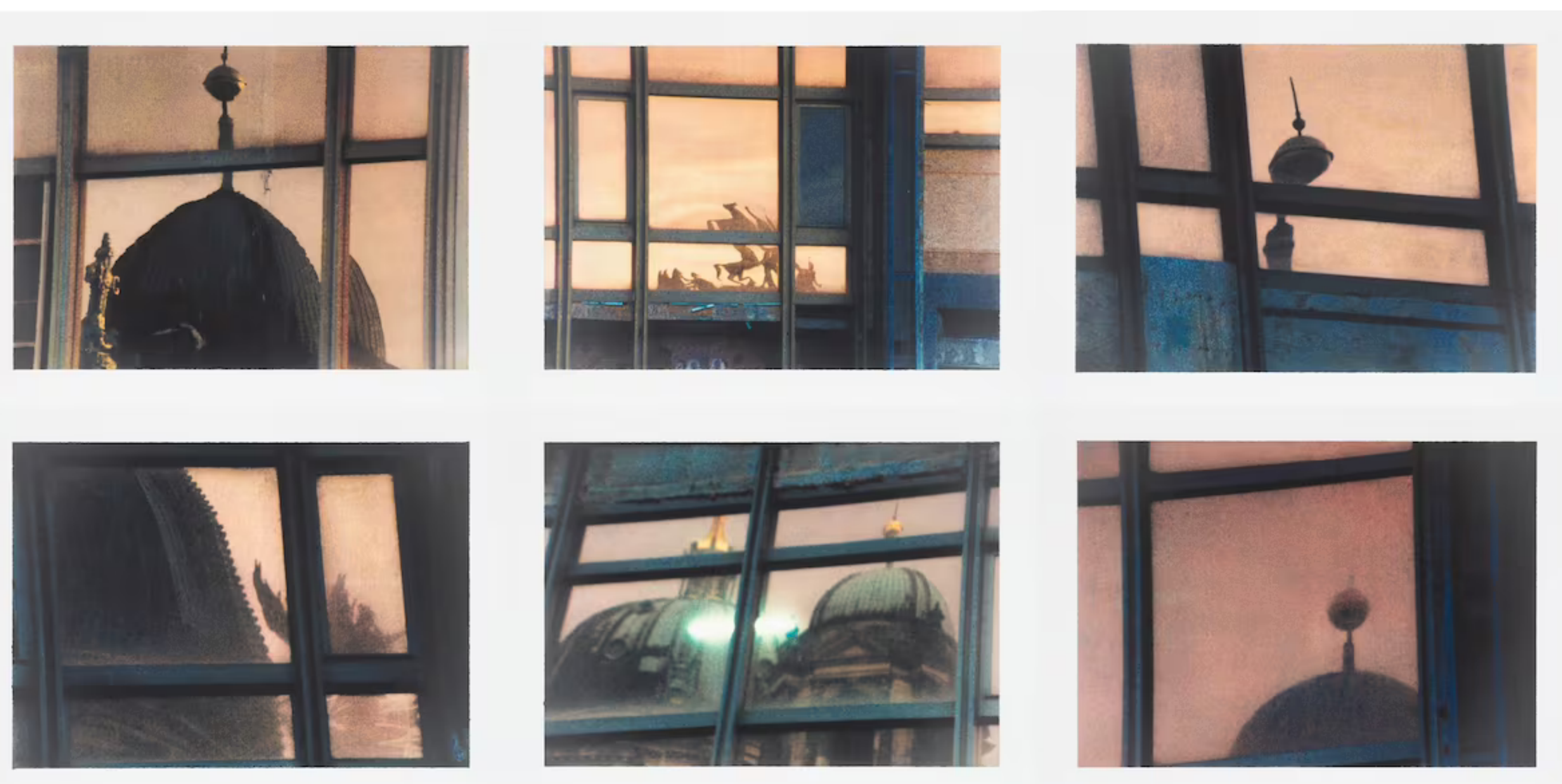
"Palast" (2005), Tacita Dean.

Una exposición reúne varias obras de la artista británica realizadas mediante la técnica del fotograbado y el 'offset', piezas que exploran su interés en la memoria colectiva y en la materialidad de la imagen. Cada impresión se convierte en un archivo vivo, un fragmento del pasado en constante cambio