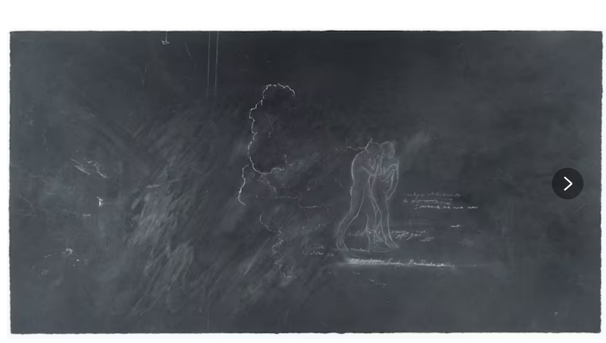
"Expulsion from Paradise" (2021), Tacita Dean.

Expulsion from Paradise (2021) es el título de un fotograbado de Tacita Dean (Canterbury, 1965). Está inspirado en un fresco de Masaccio, La expulsión de Adán y Eva del Paraíso , una de las obras que más han marcado a la artista británica. Tenía 17 años cuando viajó a Florencia, con el único objetivo de ver la pintura. Iba a ser su primer encuentro con el arte descubierto originalmente en un libro. Pero la capilla Brancacci, dentro de la iglesia Santa María del Carmine, estaba cubierta de andamios y tapada. Agachada bajo una lona azul, la joven pudo distinguir a Adán y Eva. Arrancadas de su contexto, las figuras parecían "recortadas, emblemáticas y autosuficientes". Desde entonces las ha dibujado una y otra vez. Primero sus pies, solos. Luego enteras, sobre un fondo negro, con tiza; un material utilizado, hasta hace poco, por todos los niños, que se ha convertido en la principal herramienta de esta artista. Con tiza dibuja y borra y escribe anotaciones. Para hacernos pensar en la fragilidad del ser humano, en lo que significa estar vivo, en la memoria y en el tiempo, y en la materialidad de las imágenes, mediante la simplicidad y la gracia de un único movimiento de la mano.